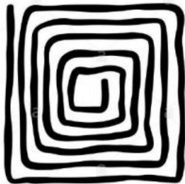
Beispiel eckige Spirale

Welche Spiralform hat dir am besten gefallen? Male dein Blatt formatfüllend mit einer aus.